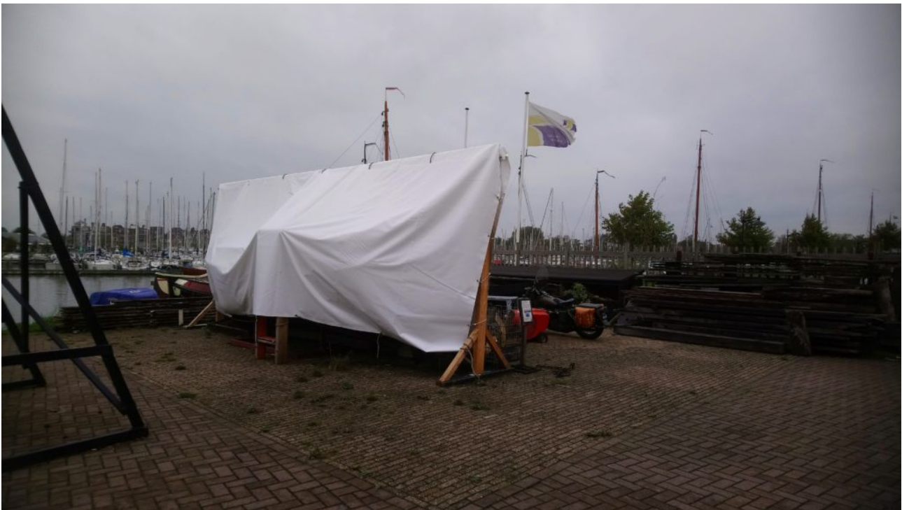
een fraaie water- en stormbestendige oplossing

Al enige tijd hebben wij geen nieuws meer geplaatst over de vorderingen aan de Pinas. Dat neemt niet weg dat er toch het een en ander gebeurd is. Om kort samen te vatten, met een voorjaarsstorm in 2017 is het oorspronkelijk dekzeil van het schip losgerukt en onbruikbaar geraakt. Inmiddels hebben wij door een noodoplossing, een bouwdekzeil, ons scheepje af weten te dekken. echter dat voldeed niet afdoende. Daarom is nu gekozen voor stevig “vrachtwagendoek” dat op een juk is bevestigd en bewezen heeft de heftige storm van januari 2018, te overleven.